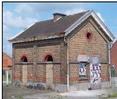
het voormalig wachthuisje