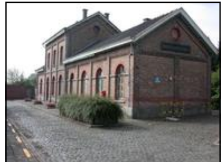
het oude station en perron (niet meer voor reizigers toegankelijk, is nu een privé woning.