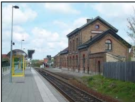
het nieuwe perron

Dichtbij het psychiatrisch centrum en voor de wandelaars die met de trein komen.